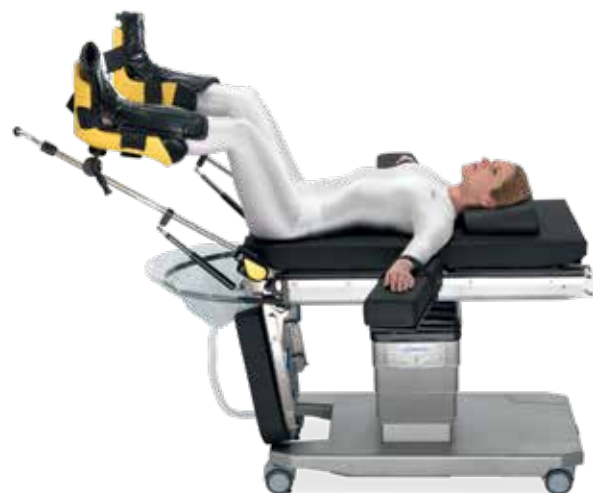
Steinschnittlagerung für Gynäkologie und Urologie