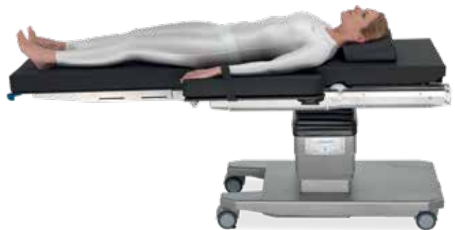
Patienteneinleitung für die Steinschnittlagerung