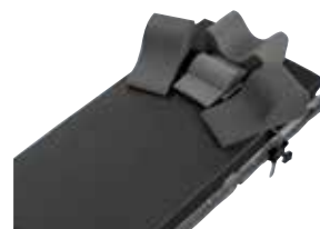
TrenGuard® für sichere, steile Trendelenburg-Positionierung.

Für weitere Informationen wenden Sie sich bitte an Ihren lokalen Hillrom Ansprechpartner.