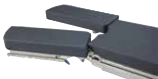
Zweiteilige Beinplatte für den Zugang zur Mittelachse.

Für die Optimierung der Patientenpositionierung während jeder Art von robotergestützter Chirurgie bietet Hillrom ein zusätzliches Portfolio an Spezialzubehör und -komponenten an.